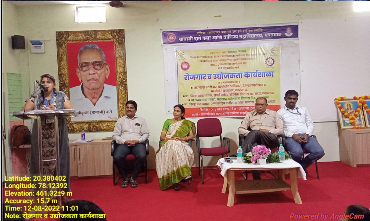
Latitude: 20.380402 Longitude: 78.12392 Elevation: 461.32±9 m Accuracy: 15.7 m Time: 12-08-2022 11:01 Note: रोजगार व उद्योजकता कार्यशाळा