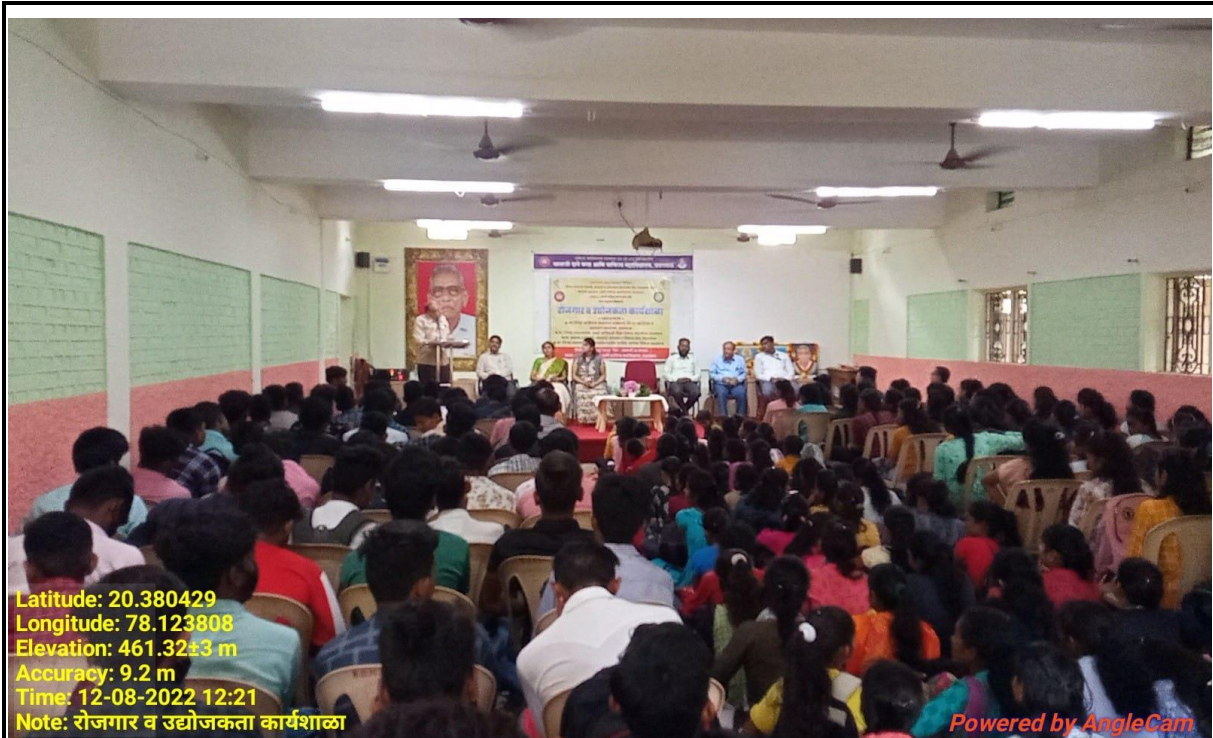
Latitude: 20.380429 Longitude: 78.123808 Elevation: 461.32±3 m Accuracy: 9.2 m Time: 12-08-2022 12:21 Note: रोजगार व उद्योजकता कार्यशाळा